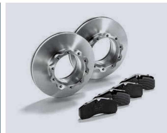
Pastiglie freno a disco