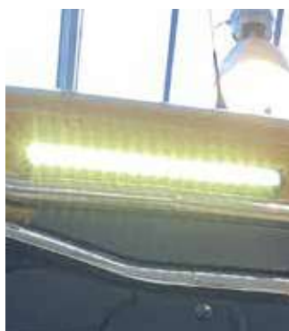
Faro abbagliante a LED barra luminosa