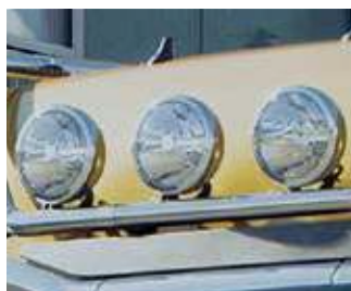
Faro a LED rotondo