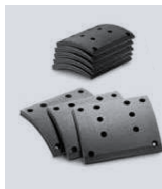
Set guarnizioni freno a tamburo