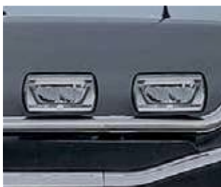
Faro a LED rettangolare