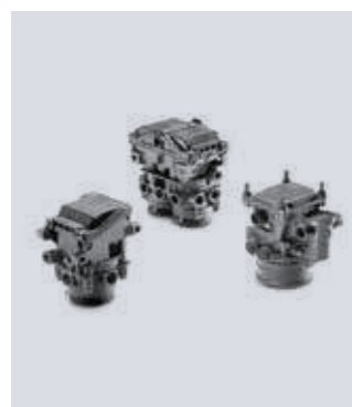
Valvola impianto frenante