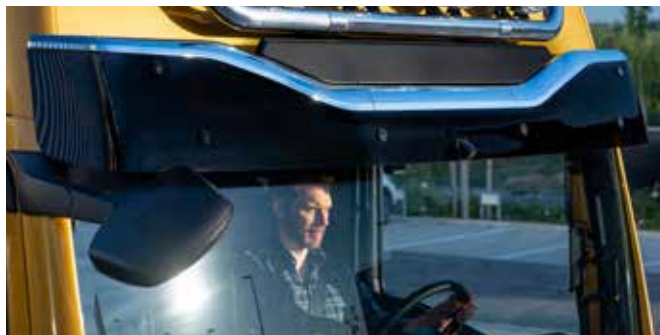
Visiera parasole Individual

Personalizza il tuo veicolo con gli accessori originali MAN, aumentando così la tua sicurezza e il tuo comfort.