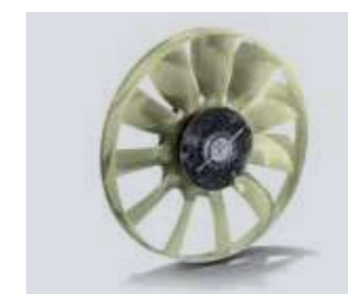
Giunto ventola raffreddamento